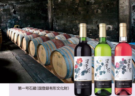
第一号石蔵(国登録有形文化財)