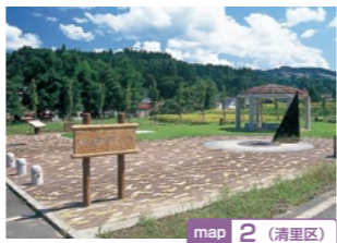
map 2 (清里区)