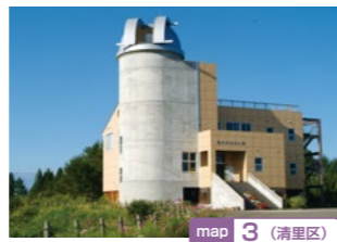
map 3 (清里区)