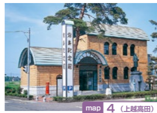
map 4 (上越高田)